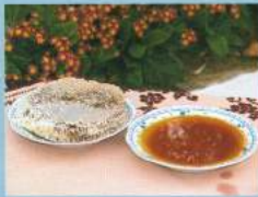
Doğanın mucizesi ünlü Muğla çam balı.