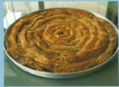
Bir Muğla markası olan ünlü Saraylı tatlısı.