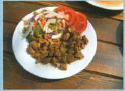
Ünlü Muğla kavurması.