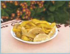
Karabağlar Yaylası'nda yetişen ürünlerden yapılan turşu.