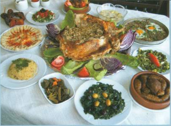
Muğla'nın damaklarda enfes tatlar bırakan yemek ve lezzetleri.